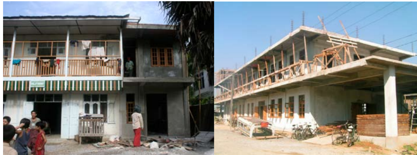
Das Waisenhaus mit neuem Anbau für Küche, mit Unterstützung der Globus- Stiftung, Aufenthaltsräume und Duschen.