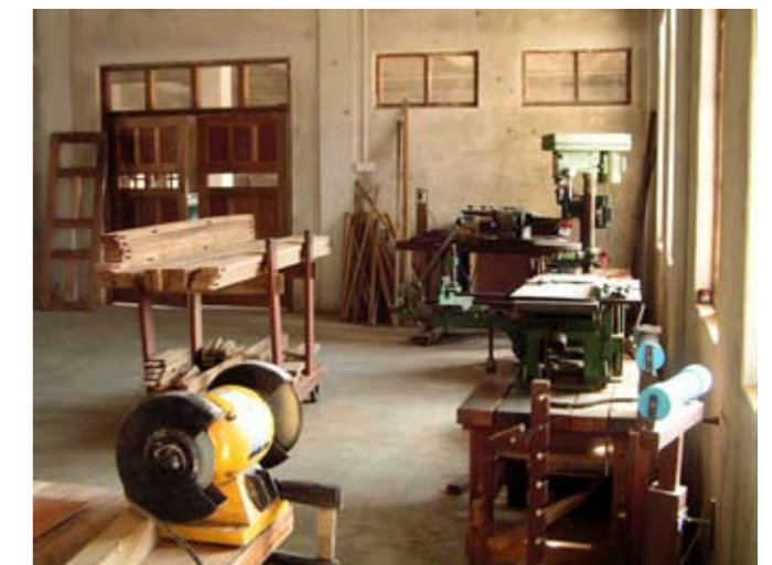
▲ erste neue baksfhdsouifhofhewro