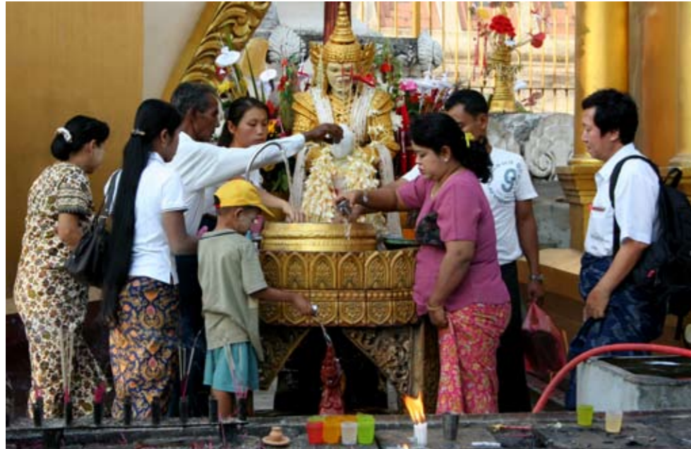
Gläubige an der Shwedagon-Pagode in Yangon

Am Inle-See haben die Inthas, die „Menschen vom See“, eine spezielle Technik entwickelt, um das Boot voranzutreiben und gleichzeitig das Netz zu bedienen: das Einbeinrudern: Ein Bein auf den Holzplanken, das andere um das Ruder gewickelt, so dass ein Arm frei ist.