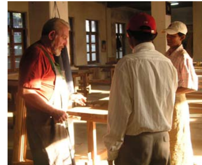
▲ erste neue baksfhdsouifhofhewro

Trotzdem präsentiert sich das Handwerk in Myanmar auf hohem Niveau mit einer hoch entwickelten Tradition. Eine erstaunliche Geschicklichkeit im Herstellen von Bildern, Skulpturen, Gebrauchsgegenständen ist zu beobachten, ein technisches und handwerkliches Können, wie es über Generationen von den Vätern an die Kinder weitergegeben wurde. Doch die Chancen hängen von den richtigen Beziehungen ab! Das wollten wir ändern.