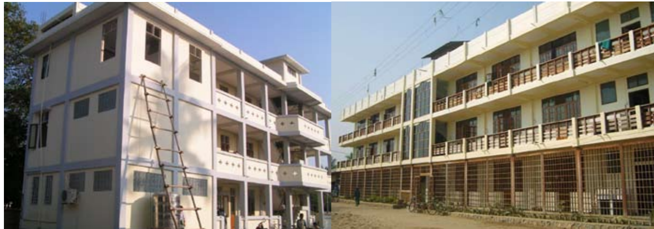
Schulambulanz mit einheimischen Ärzten, kostenlose Behandlung für die Kinder und ihre Familien.

Unser Bestreben ist es, den Schulunterricht mit Internat und Berufsausbildung zu verbinden. Die Vernetzung der Projekte verstärkt deren Wirkung.