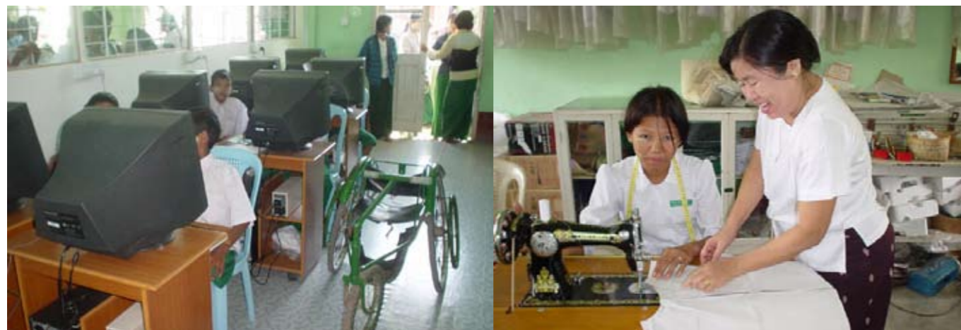
4 Computerklassen in Mingun wurden eingerichtet, Unterricht auch für Behinderte.